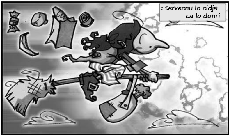
: tervecnu lo cidja ca lo donri