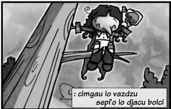
: cimgau lo vazdzu sepi'o lo djacu bolci