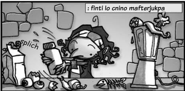
: finti lo cnino mafterjukpa