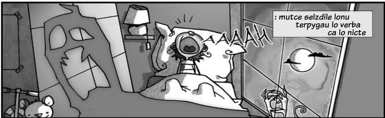
: mutce selzdile lonu terpygau lo verba ca lo nicta