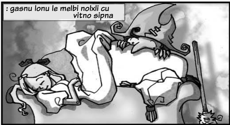
: gasnu lonu le melbi nolxi cu vitno sipna