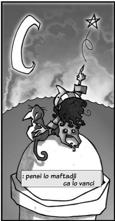
: pensi lo maftadji ca lo vanci